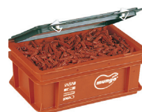
MN MAXI - BOX