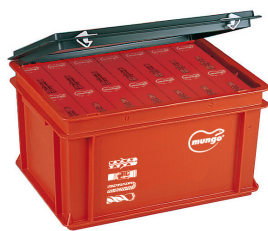
MU MAXI - BOX