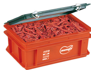
MU MINI BOX